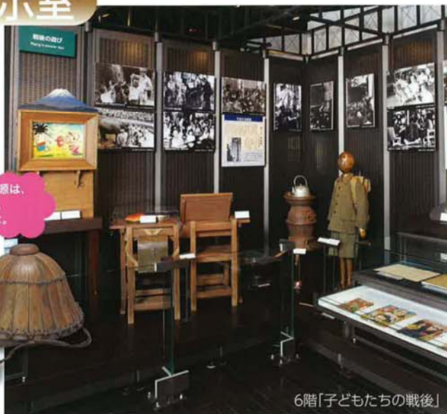
6階「子どもたちの戦後」