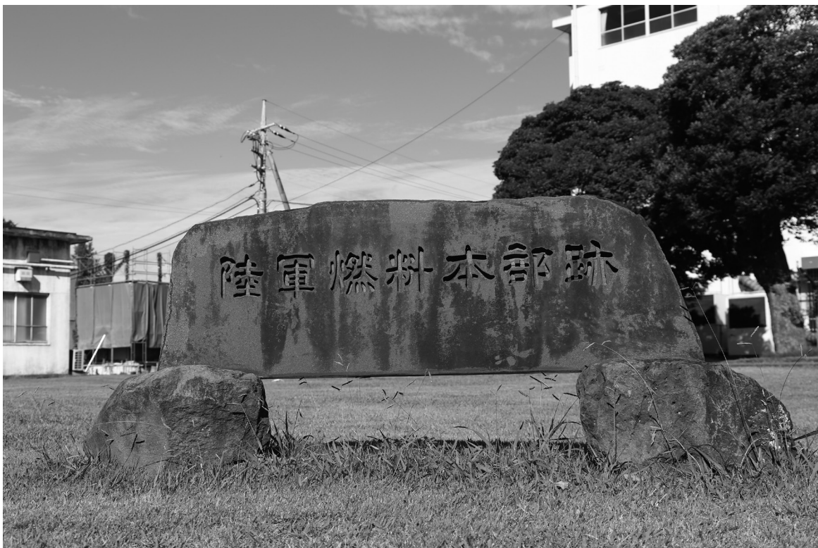
【図2】陸軍燃料本部跡の記念碑 令和6年10月

そのような傾向の本書で、第一章「戦争の記憶」として分類されているものは三十四編あり、それぞれが「空襲」七編、「銃後」四編、「女性」五編、「原爆」八編、「戦地」六編、「兵士」四編に分類されている。