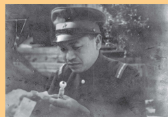
通信こけしで届いた手紙を読む兵士 撮影場所不詳 昭和20年以前