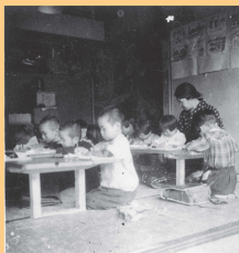
疎開先での授業風景 栃木県日光市 昭和19年～昭和20年