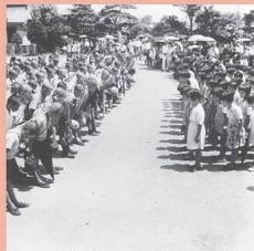
学童疎開に出発する生徒たち 下級生に別れのあいさつ 場所不詳 昭和19年8月4日