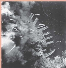
神戸大空襲 兵庫県 昭和20年6月5日