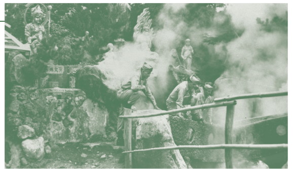
「別府温泉を訪れた米第19歩兵連隊の兵士」 昭和23年(1948)米国立公文書館提供