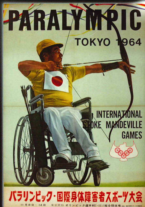
ポスター「パラリンピック」 昭和39年(1964)