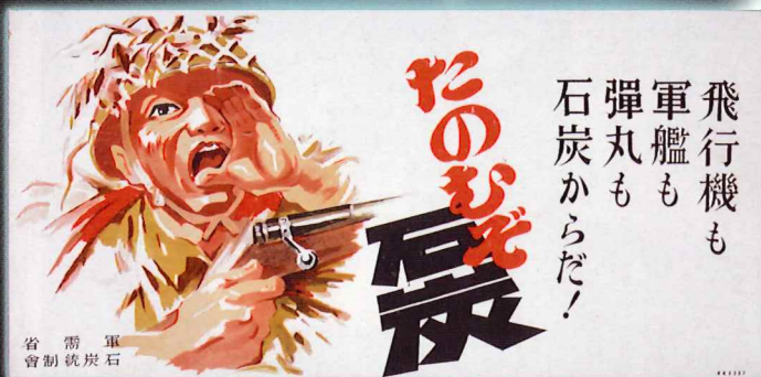
ポスター「たのむぞ石炭」 昭和18年(1943)