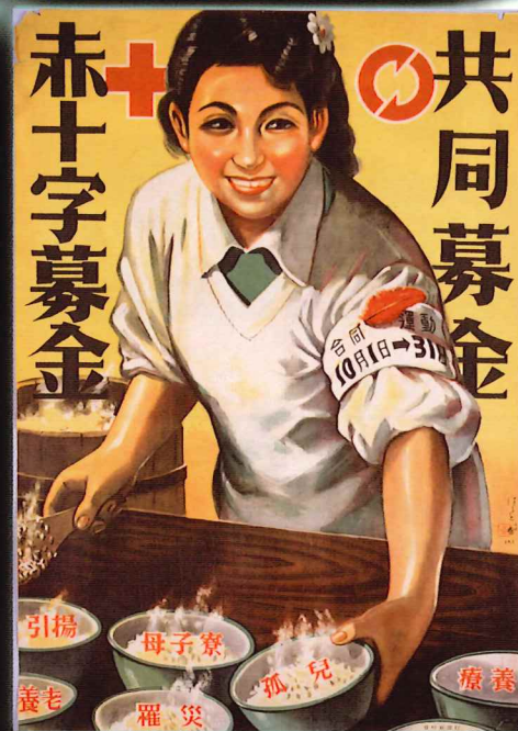
ポスター「共同募金 赤十字募金」 昭和24年(1949)5月