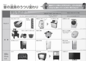
「昔の道具のうつり変わり」パネル