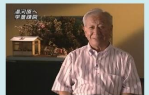
オーラルヒストリー(証言映像) DVD