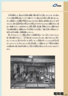
グラフィックパネル

戦中・戦後に使われていた実物資料。 文章と写真で紹介するグラフィックパネル。 当時の体験談を収録した DVD。