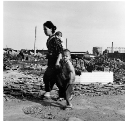
焼け跡を歩く母子 昭和20年(1945)9月

本展では、実物資料を中心に、厳しい時代を生き抜いた人々が綴った手記や、その姿を記録した写真を通じ、母や子、そしてその時代に生きた人々の様々な思いや、苦難の多かった暮らしを紹介します。