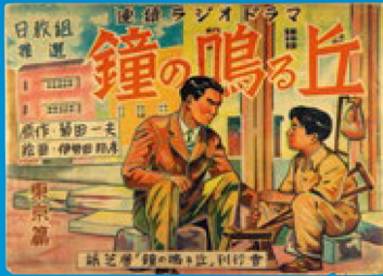
紙芝居「鐘の鳴る丘・東京編」 昭和23年(1948)