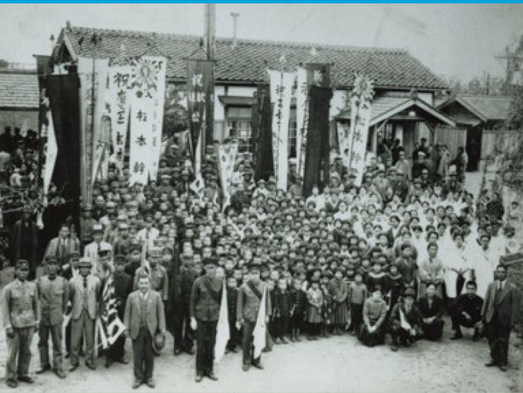
夜見村(現・米子市)の入営見送り 昭和14年(1939)頃 『新修米子市史 第13巻』より 米子市立山陰歴史館 提供