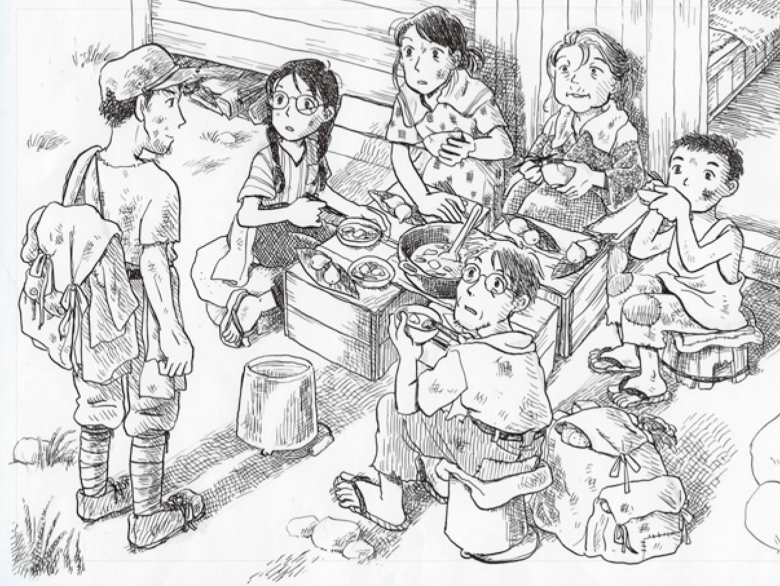
昭和21年(1946) 「この史代が描いた昭和のくらし」より 画：この史代/平成23年(2011)