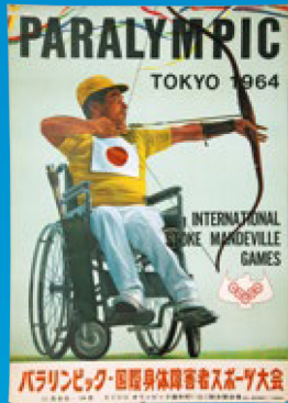
「パラリンピック 東京 1964」 一般用公式ポスター デザイン：高橋春人 昭和39年(1964)