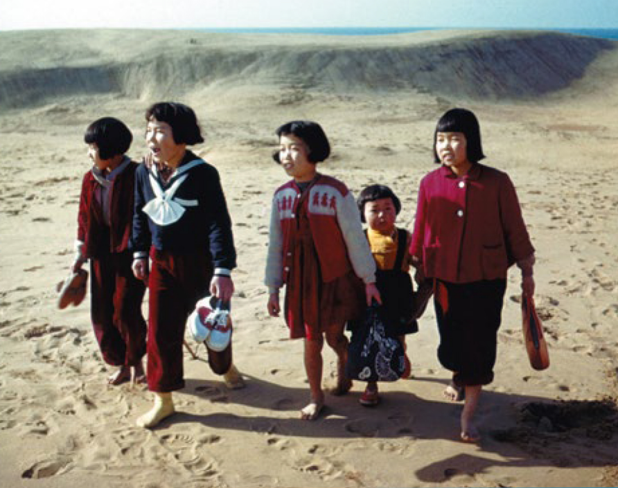
鳥取砂丘を裸足で歩く子どもたち 昭和28年(1953)