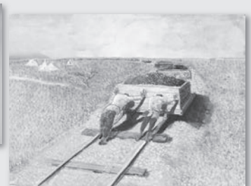
▲早田貫一《バム鉄道建設》