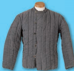
▲盛岡から出征した兵士が抑留中に着ていた防寒服

酷寒のシベリアで、過酷な労働と飢えに苦しみ続けた戦後強制抑留者。その労苦を伝える資料をキーワードとともに紹介します。