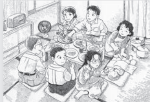
▲昭和26年(1951)頃 ©この史代