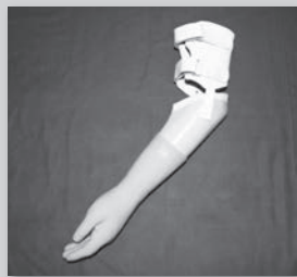
▲県内の戦傷病者の方から寄贈された義手

しょうけい館(戦傷病者史料館)は、戦傷病者とそのご家族が戦中・戦後に体験したさまざまな労苦について知る機会を提供する施設です。しょうけい館では、より多くの方に知っていただくために全国で企画展を開催しています。本展では、戦場だけがを負った際に身に着けていた資料を中心に展示し、さまざまな障害を乗り越えようとした人々の姿を紹介します。