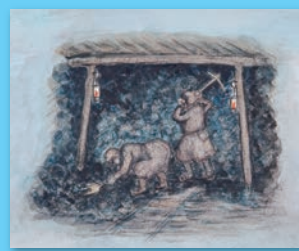
▲川口光治《坑内切羽》