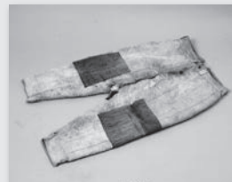
▲岩手県出身の抑留体験者が収容所で着用した作業スポン

平和祈念展示資料館(東京・新宿)は、さきの大戦における兵士、戦後強制抑留者、海外からの引揚者の労苦を広く知っていただくための施設です。本展では、過酷な抑留生活を物語る資料や絵画を10のキーワード「戦闘・略奪・連行・酷寒・重労働・飢餓・傷病・埋葬・教育・帰国」に沿って展示し、シベリア抑留について読み解きます。