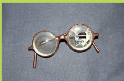
▲受傷時にかけていたメガネ

戦争で傷つき、あるいは病にたおれた方とご家族が戦中・戦後に体験したさまざまな労苦を紹介します。