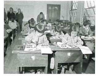
「習字の授業」 昭和20年11月 長崎県佐世保市