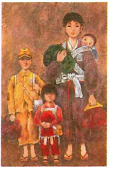
「焦土に立つ」 画：根本圭助