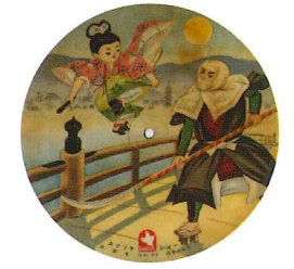
「牛若丸」 歌：須賀みち子