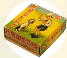
明治ミルクキャラメル 昭和4年(1929)発売 明治製菓株式会社

いつの時代でも、お菓子は子どもたちにとって幸せをもたらしてくれる存在です。記憶を紐解けば、誰の思い出の中にもお菓子の記憶はあることでしょう。本企画展では、戦前から戦中・戦後のめまぐるしく変化する昭和の時代において、お菓子とその一番のパートナーである子どもたちがどのような生活を送ったのかを紹介いたします。