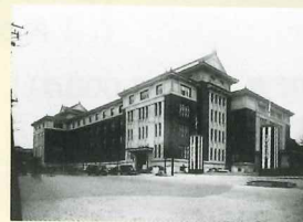
軍人会館竣工式 昭和9年(1934)3月

昭和館に隣接する九段会館は、昭和3年(1928)昭和御大礼記念事業の一環として建設が計画され、昭和9年に竣工・落成しました。現在、大規模な改修工事を経て、令和4年(2022)7月竣工、同年10月3日に九段会館テラスとして開業される予定です。本企画展では、昭和の激動を見つめ続けた九段会館の歴史を紐解きます。