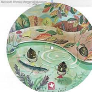
・SPレコード ピクチャーレコード どんぐりころころ (歌: 池田まり)