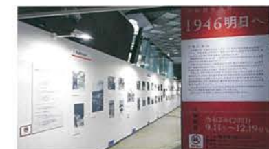
・写真展示場 2階ひろば 年に2回写真展を開催