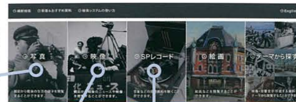
昭和館 National Diet Memorial Museum 映像・音響室