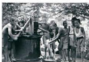
・写真 疎開先での生活 昭和19年(1944)9月