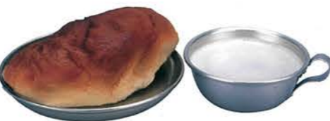
学校給食 (コッペパン、脱脂粉乳)