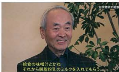
・映像 オーラルヒストリー 戦前から戦後の体験談を収録した映像、オーラルヒストリーは約400点公開しています。