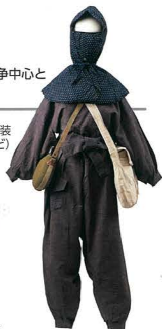
防空服装 (防空頭巾やもんぺなど)