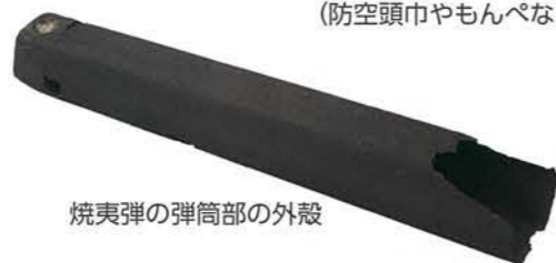
焼夷弾の弾筒部の外殻