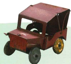
ジープのおもちゃ

見学中の活用はもちろん 見学前の予習や見学後の復習にも活躍! アプリをダウンロードすれば お家でも昭和館の展示を楽しめます。