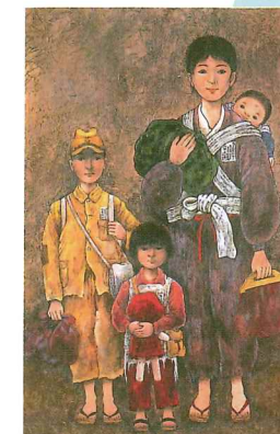
「焦土に立つ」 画：根本圭助