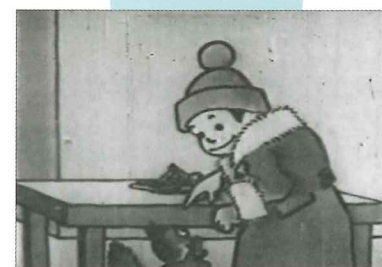
アニメ「正チャンの冒険」