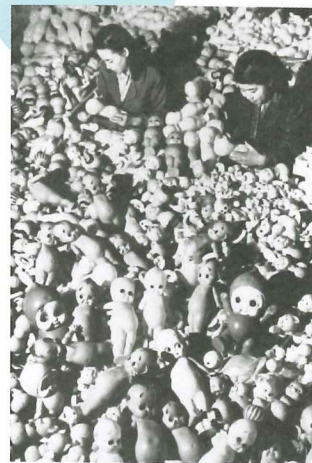
「セルロイド人形の製造」 昭和24年1月：東京都