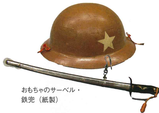
おもちゃのサーベル・鉄兜(紙製)