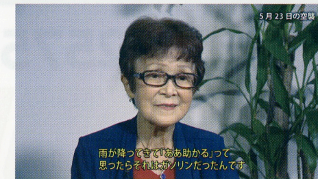
▲戦前から戦後の体験談を収録した映像、 オーラルヒストリーを約350点公開しています