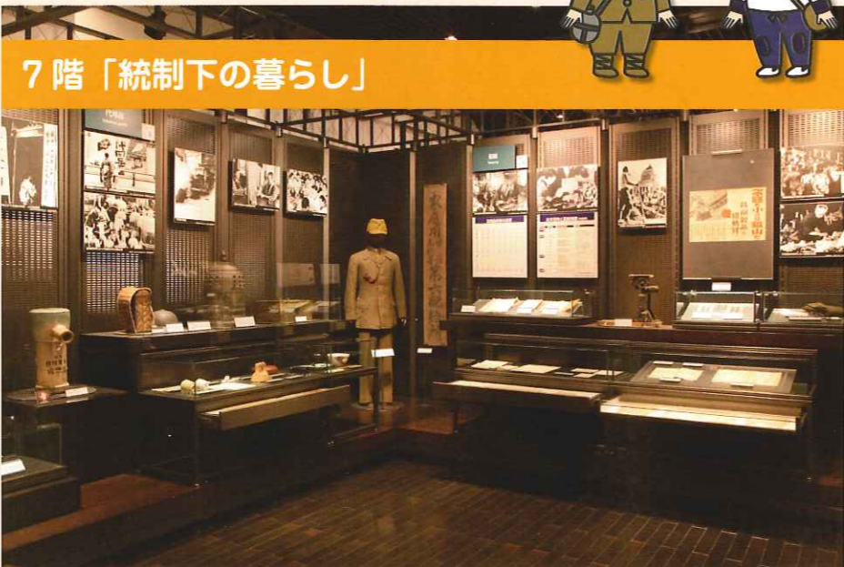
7階「統制下の暮らし」