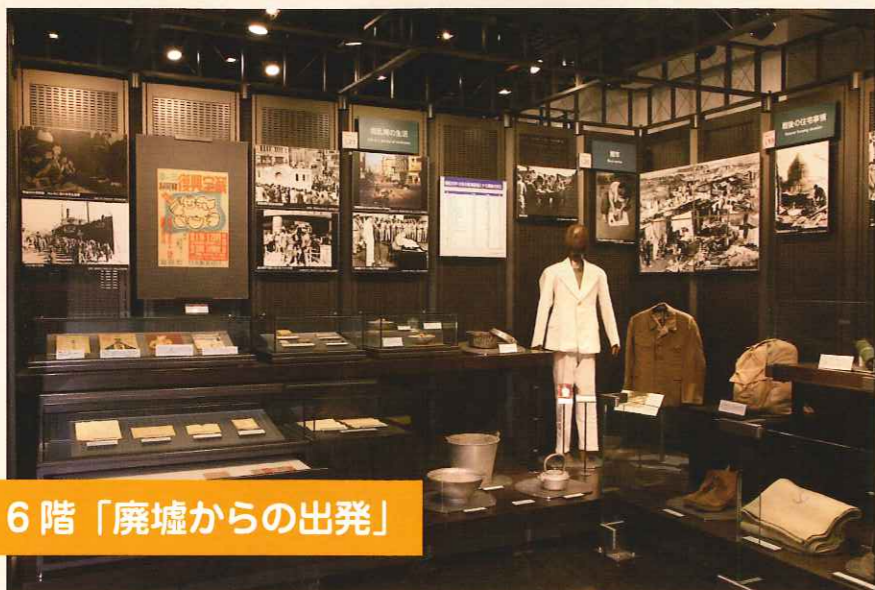
6階「廃墟からの出発」