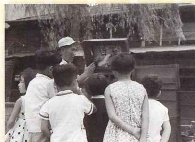
白金児童遊園(猿町公園) 昭和36年(1961)7月