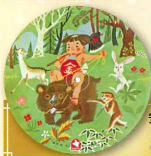
安藤良人 歌 「金太郎」 (レコード)