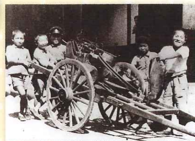
鉄くずを集める子供たち 昭和13年(1938)