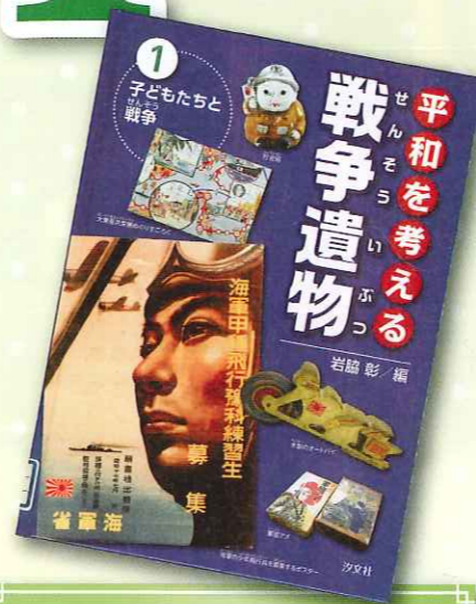
平和を考える戦争遺物 1 子どもたちと戦争 汐文社

図書室には、夏休みの宿題や調べ学習に役立つ本がたくさんあります。 昭和のくらしや子どもたちの生活など、いろいろ調べてみましょう。