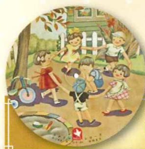
池辺まり 歌 「かごめかごめ」 (レコード)