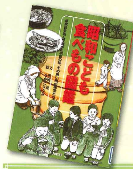
昭和子ども食べもの図鑑 ポプラ社