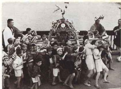
浅草の子供みこし 昭和24年(1949)5月24日