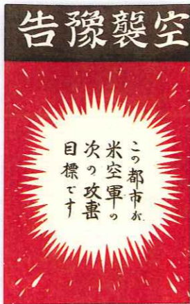
伝単 アメリカ軍の飛行機によって 散布されたビラ