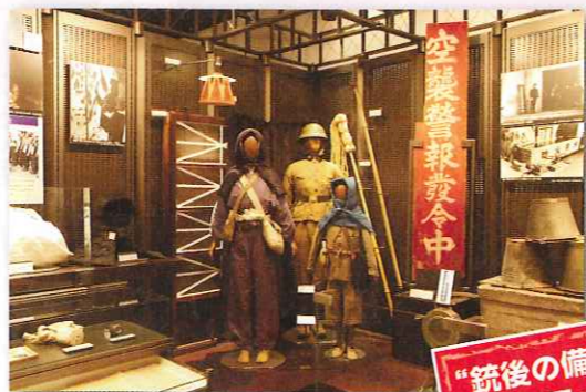
“戦後の備えと空襲” のコーナー