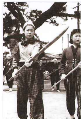
竹槍訓練をする女性たち・ 鹿児島県曾於郡志布志町 昭和20年(1945)7月3日