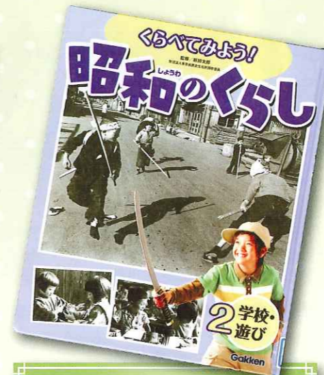
くらべてみよう! 昭和のくらし 2 学校・遊び 学習研究社