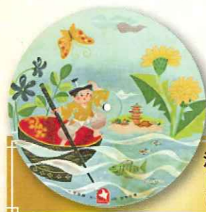
沢地弘恵 歌 「一寸法師」 (レコード)