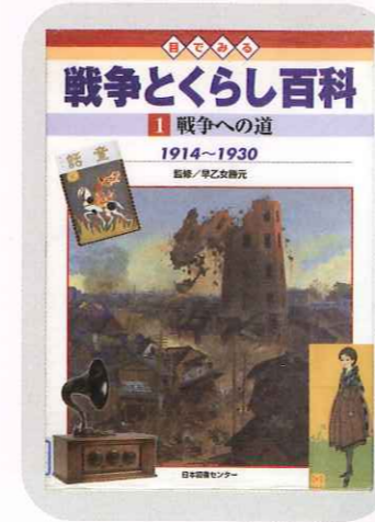
戦争とくらしの百科 1 戦争への道 日本図書センター

夏休みの役立つ本を見てみよう。これらの本は児童書架にあります。 ほかにも疑問を解決する多くの図書がありますので、ぜひご覧ください。