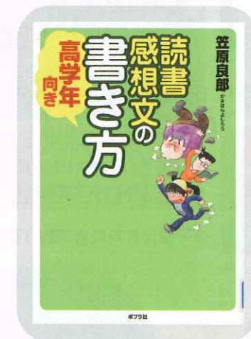
読書感想文の書き方 高学年向き ポプラ社