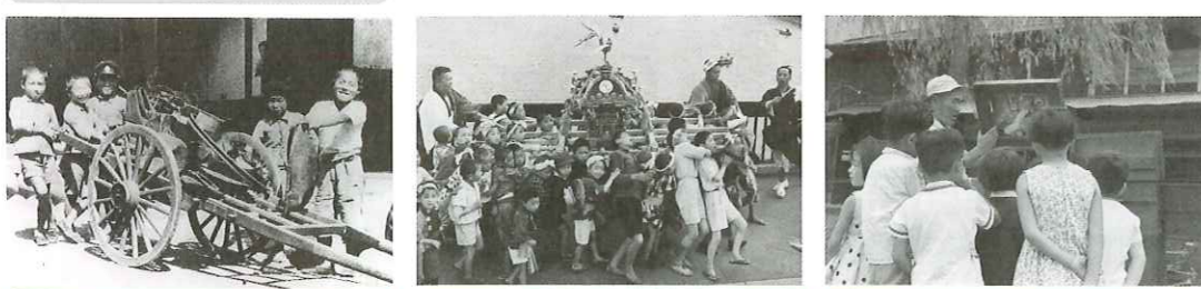
鉄くずを集める子供たち 昭和13年(1938) 浅草の子供みこし 昭和24年(1949)5月24日 白金児童遊園(猿町公園) 昭和36年(1961)7月