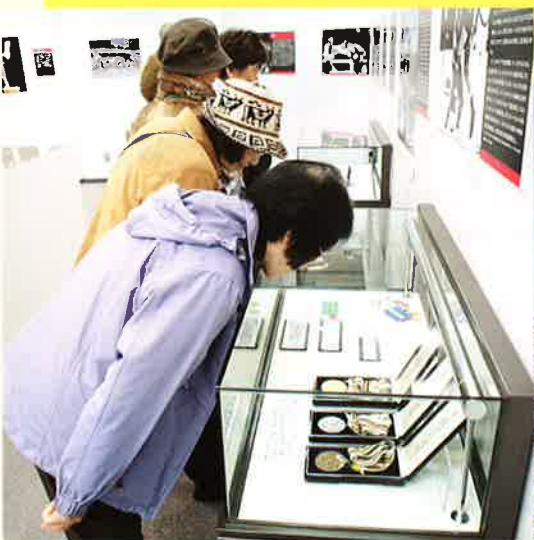
東京オリンピックの表彰台(復元)▶