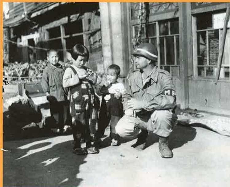
占領下の日本(昭和20年)

昭和館には戦中から戦後にかけてアメリカ軍が日本の様子などを撮影した記録映像や写真、体験者の証言ビデオを多数収蔵しています。平成19年11月23日(金)から平成20年2月11日(月)までの土曜・日曜・祝祭日に、これらの資料をさらに多くの方に見ていただくことを目的に、「敗戦と占領下の日本」と題し、主な都市への空襲、終戦直後の進駐軍や人々の生活の様子などについて記録映像を中心に編集して、特別上映しました。