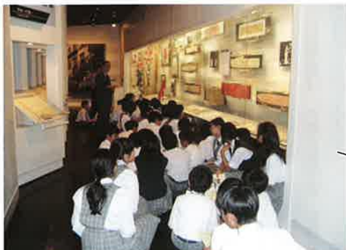
説明員がわかりやすく説明します