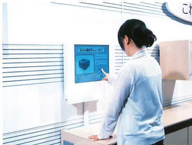
「バーチャルこれなあに？」

昭和館では、平成十八年七月一日に常設展示室をリニューアル・オープンしました。本号では、そのリニューアルの内容についてご紹介いたします。