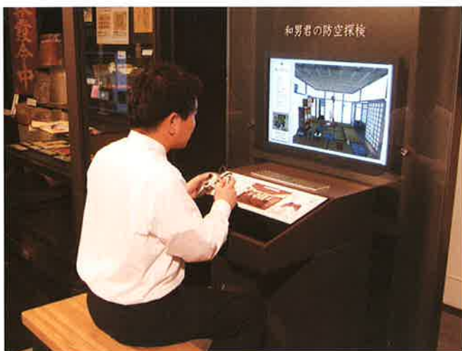
「和男君の防空探検」