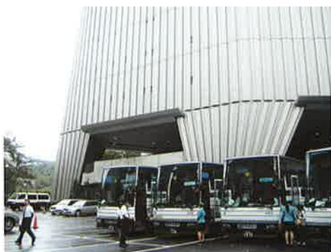
たくさん学校のバスで来館します

修学旅行や総合学習、社会科学習などの見学先、学習の場として昭和館を是非ご利用ください。職員一同、みなさんのご来館を心よりお待ちしております。