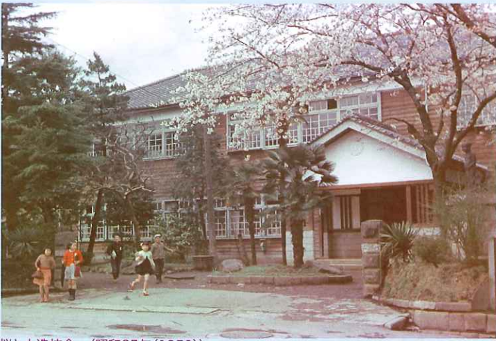
桜と木造校舎 〈昭和25年(1950)〉

今年も桜の季節になりました。多くの方がお花見を楽しみむことでしょう。 昭和館や九段下周辺の桜も毎年みごとな花を咲かせ、多くの人を楽しませてくれます。 今回の写真展では戦前から戦後の各地の桜やお花見をする人びとの様子を、当館が収蔵している絵はがきや写真の中から紹介します。 昭和館周辺で咲き誇る桜とともに、 ごゆっくりご覧ください。