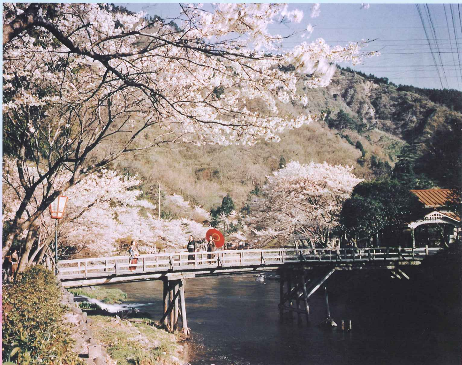
嵐山で花見をする和服の女性たち 〈戦後〉