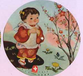
桜が描かれたピクチャーレコード