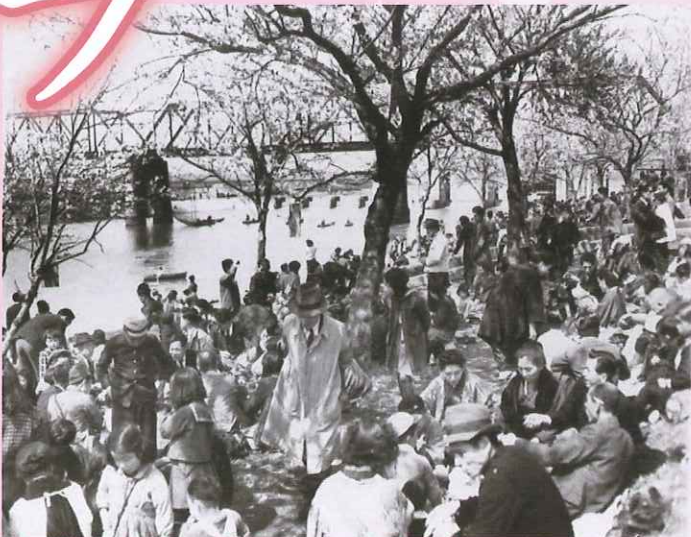
多摩川の土手で花見をする人たち 〈昭和25年(1950)〉