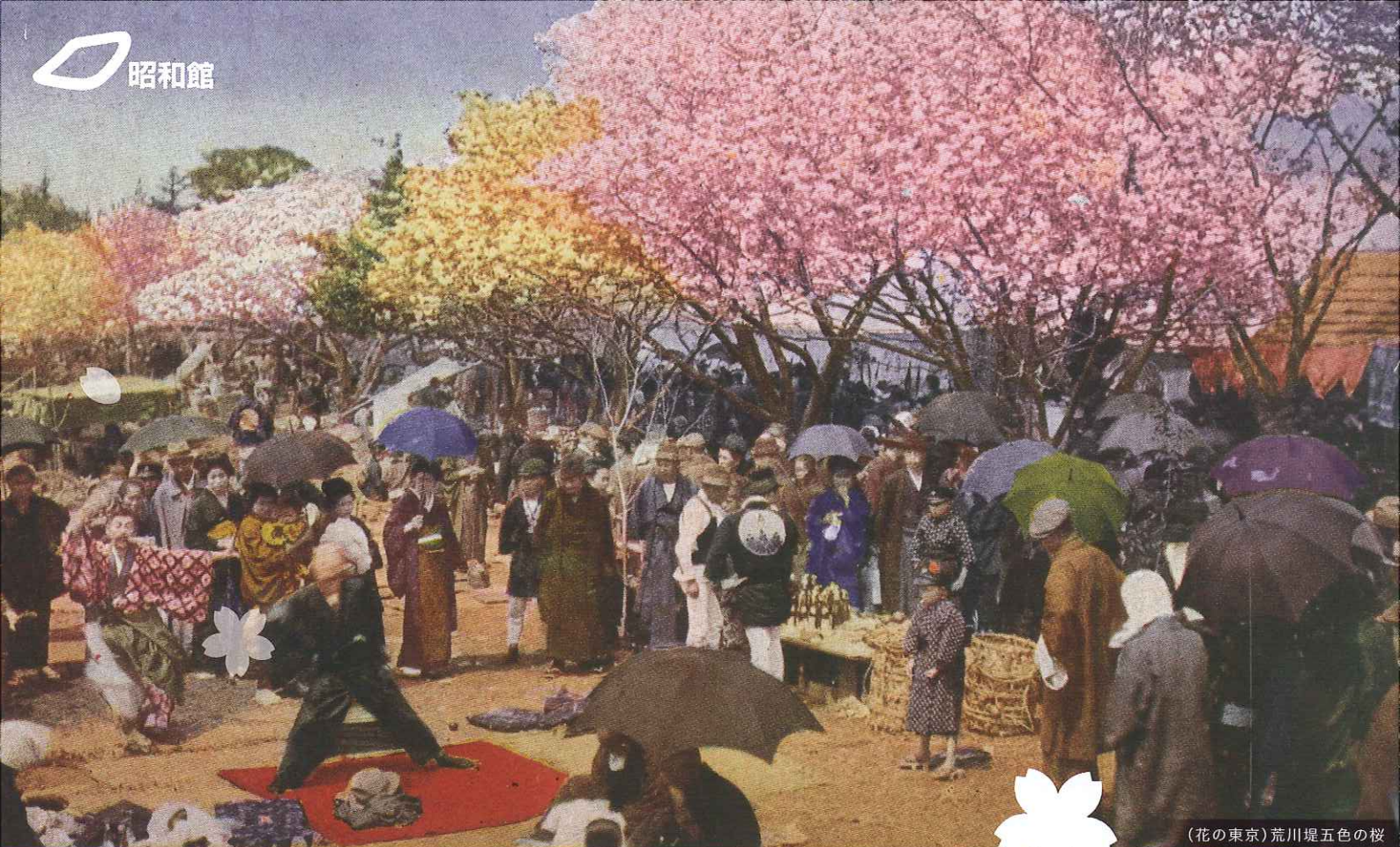
(花の東京) 荒川堤五色の桜