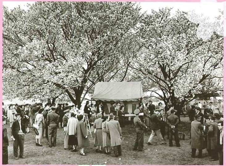
新宿公園で開かれたガーデンパーティー