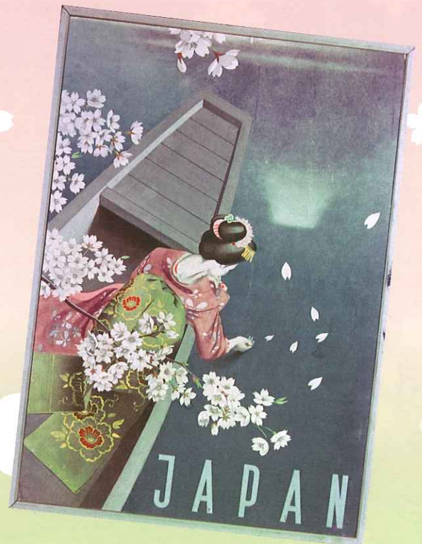
「JAPAN」旧財団法人日本交通公社が作製したと思われる日本紹介のポスター