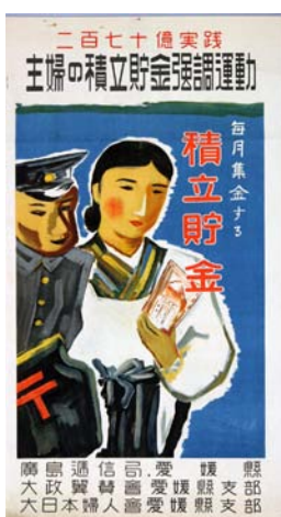
ポスター「主婦の積立貯金強調運動」 広島通信局、愛媛県、大政翼賛会愛媛県支部、大日本婦人会 愛媛県支部