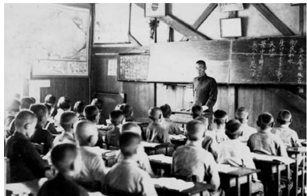
国民学校の授業風景・中ノ口国民学校