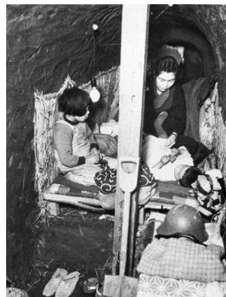
防空壕の中の母子 昭和20年(1945)

本展では、実物資料を中心に、厳しい時代を生き抜いた人々が綴った手記や、その姿を記録した写真を通じ、母や子の様々な思いや労苦、当時の世相や苦難の多かった暮らしを紹介します。