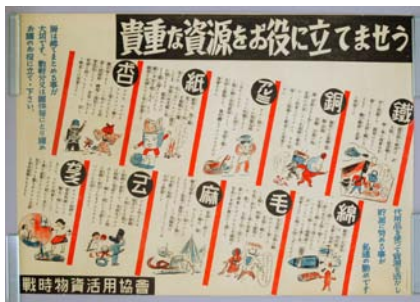
ポスター「貴重な資源をお役に立てませう」