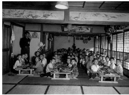
疎開先での授業風景 長野県浅間温泉に疎開していた代沢国民学校(現・世田谷区立代沢小学校)の学童 昭和 19 年(1944)9 月